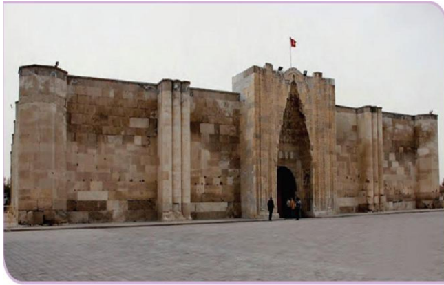
Görsel 1.15: Sultan Hanı - Aksaray

• Konya'da Mevlana Celaleddin-i Rumi 13. yüzyılda yaşamış ve ünlü Mesnevisini kaleme almıştır.