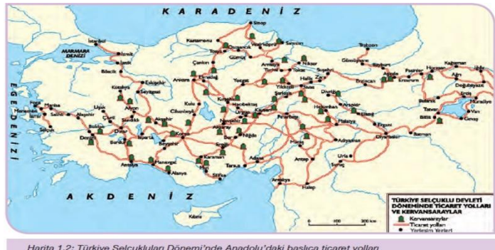
Harita 1.2: Türkiye Selçukluları Dönemi'nde Anadolu'daki başlıca ticaret yolları