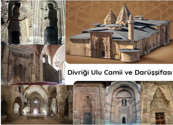
Divriği Ulu Camii ve Darüşşifası