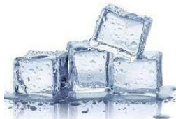
Buz ( katı )