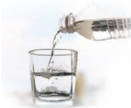
Su ( sıvı )

Altın Bilgi 4° : Suyun katı , sıvı ve gaz hâlini gözlemlemek kolaydır. Suyu buz kalıbına koyup buzluğa koyarsak bir süre sonra katı hâli olan buza döner. Buzu alıp oda sıcaklığında tutarsak tekrar sıvı olur. Suyu çaydanlığa koyup kaynatırsak bir süre sonra su buharını gözlemleyebiliriz. Bu da suyun gaz hâlidir .