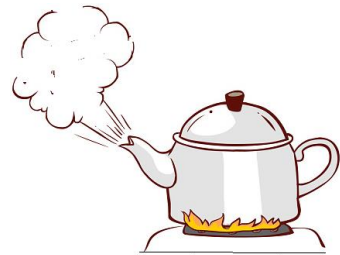
Su buharı ( gaz )