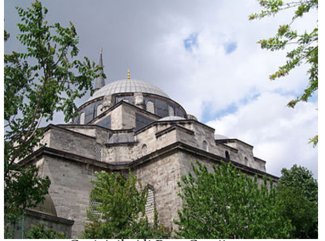
Gazi Atik Ali Paşa Camii

“Çok zarif ve kıymetli taş ve mermerlerle yaptırılan bu caminin benzerini görmek hemen hemen imkansız. İç kısımda fevkalade sanatkârane inşa edilmiş. Cami tertemiz, yerde yahut halıların üstünde bir damla kandil yağı görmek mümkün değil.