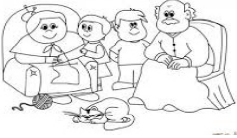
Dedem ile Ninem

1. Aşağıdaki metni okutunuz. Metin yazılmayacak.